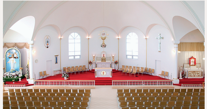
La chapelle Spiri-Maria

Venez tous à Spiri-Maria, Elle et Lui vous y attendent. ■