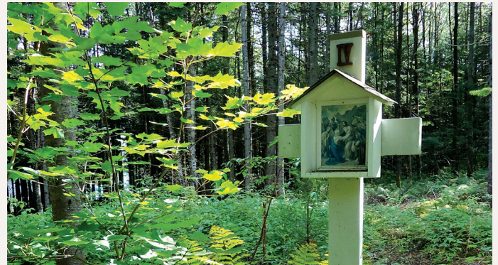
Une station du chemin de croix