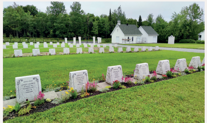
Le cimetière Marie-Reine